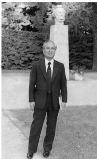
パイロイト祝祭劇場前庭，ワグナー像前にて 1985年7月25日